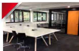
Espace de coworking