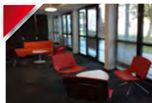
Espace de coworking