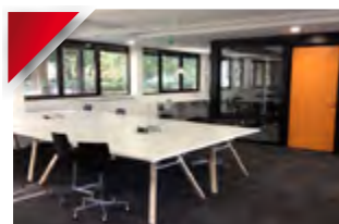
Espace de coworking